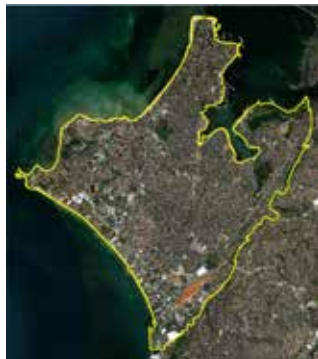
COORDENADAS DA POLIGONAL ITAPAGIPE