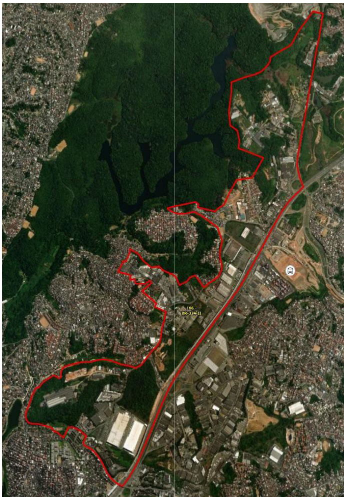
PROGRAMA LOGÍSTICO DE SALVADOR POLO LOGÍSTICO BR-324-II