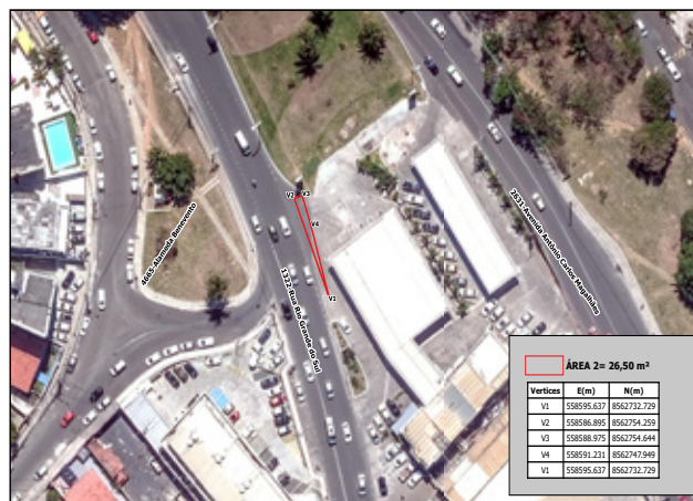
End.: Av. Antônio Carlos Magalhães, Pituba, SSA - BA

PREFEITURA MUNICIPAL DE SALVADOR SECRETARIA DA FAZENDA - SEFAZ COORDENADORIA DE ADMINISTRAÇÃO DO PATRIMÔNIO - CAP SETOR DE DESAPROPRIAÇÃO DE IMÓVEIS - SEDIIM SISTEMA ORTOFOTOCOPIA E CADASTRAL DE SALVADOR - SCSO 2008 MARK DE LOCALIZAÇÃO ESCALA DO MAPA: 1:500 IMPRESSÃO: 18/04/2022