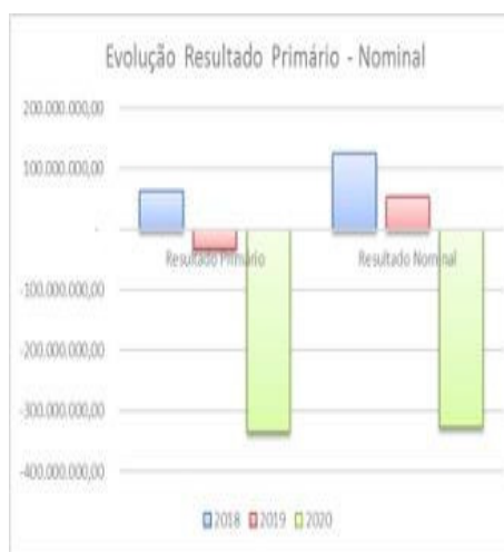
Gráfico 1 – Variação do Resultado Primário Nominal entre 2018 até 2020.

Sobre as receitas primárias realizadas nestes exercícios, 2019 e 2020, apesar da forte retração econômica ocorrida em 2020, que acarretou uma queda na arrecadação tributária de mais de 12% em valores nominais, estas apresentaram um aumento devido, principalmente, às transferências extraordinárias da LC 173/2020 e da MP 938/2020 e dos valores transferidos pelo SUS para combate a pandemia.