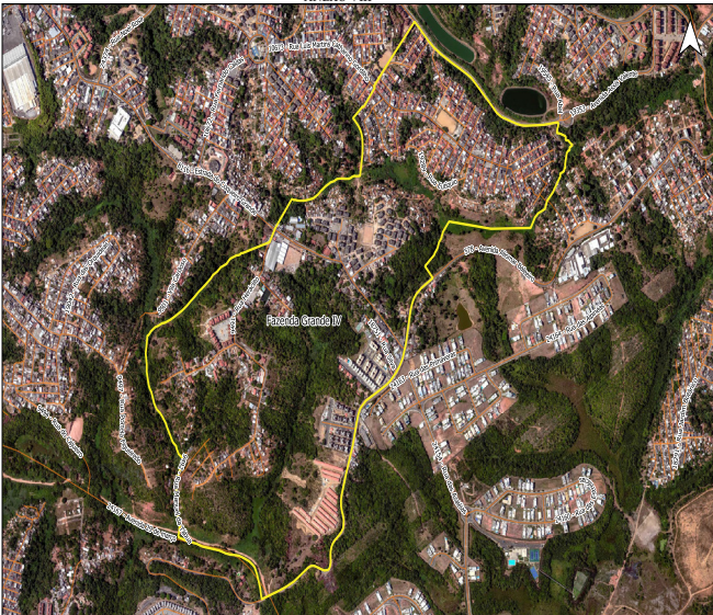
Litorâneo Barrio - Favela Grande IV

Fonte: Ortofoto: 2016, 2017 Linha Vermelha: 2/2017 Projeção: UTM - 50QDQ2000_24S Escala: 1:1.000