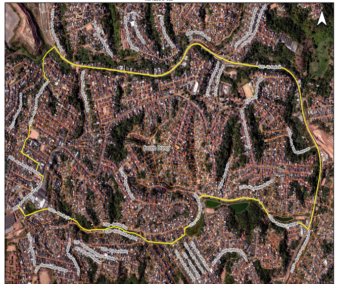
Litorâneo Barrio - Castelo Branco

Fonte: Ortofoto: 2016, 2017 Linha Vermelha: 2/2017 Projeção: UTM - 50QDQ2000_24S Escala: 1:1.000