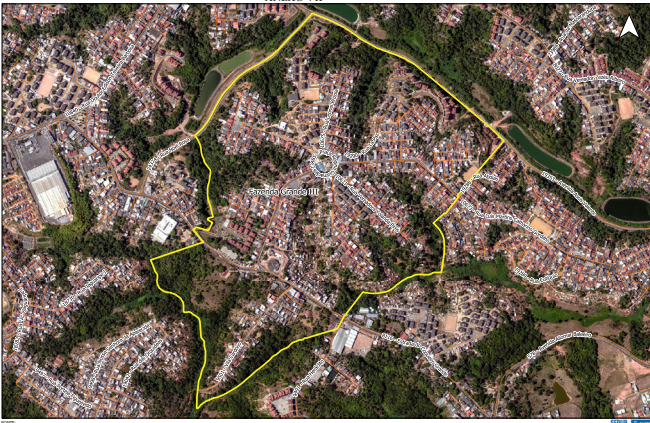
Litorâneo Barrio - Favela Grande III

Fonte: Ortofoto: 2016, 2017 Linha Vermelha: 2/2017 Projeção: UTM - 50QDQ2000_24S Escala: 1:1.000