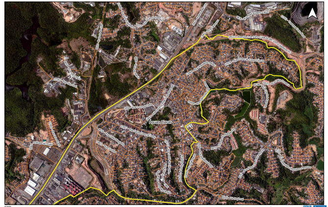
Litorâneo Barrio - Agreste Oeste

Fonte: Ortofoto: 2016, 2017 Linha Vermelha: 2/2017 Projeção: UTM - 50QDQ2000_24S Escala: 1:1.000