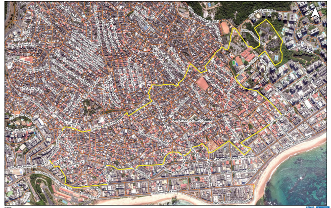
Litorâneo Barrio - Nordeste de Amaral

Fonte: Ortofoto: 2016, 2017 Linha Vermelha: 2/2017 Projeção: UTM - 50QDQ2000_24S Escala: 1:1.000