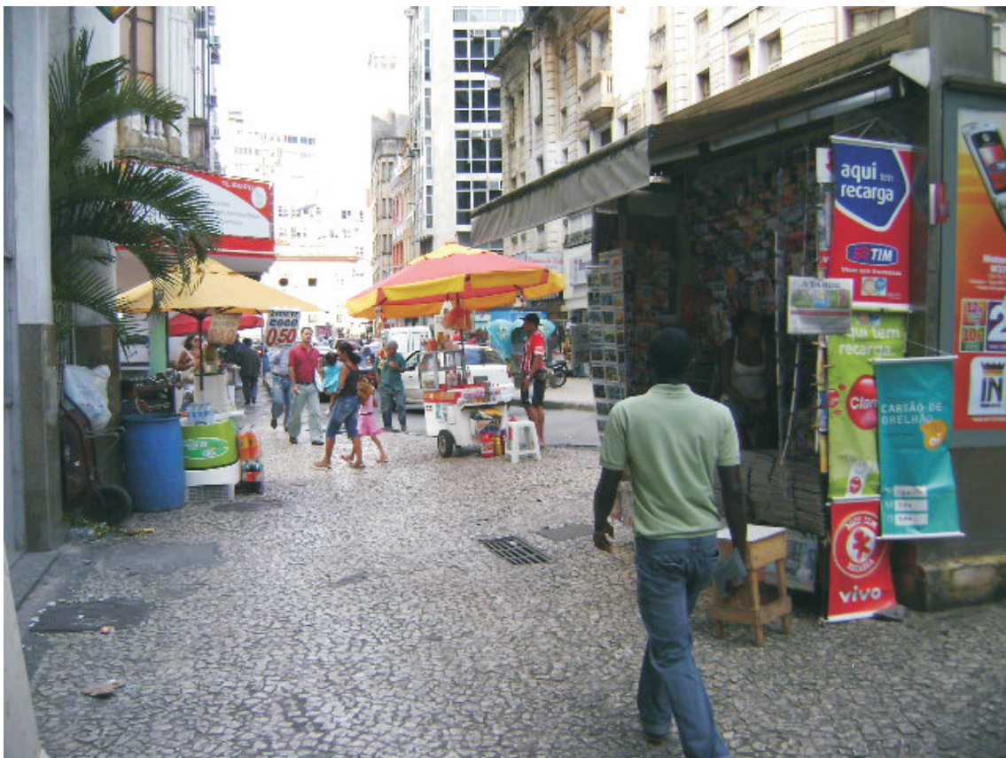
Vista de passeio da Ricardo Eletro situado à Rua Conselheiro Dantas