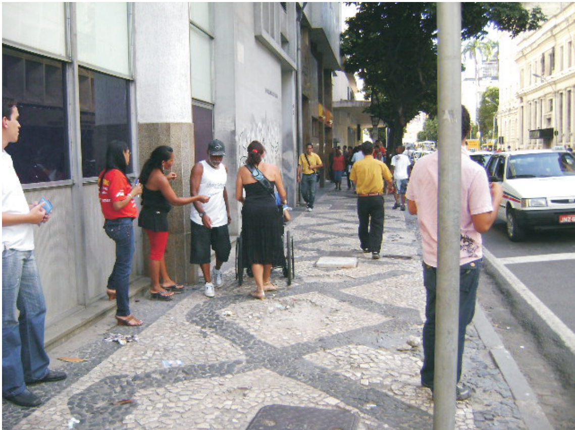
Vista de passeio situado à Rua Miguel Calmon (Edif. Bradesco)