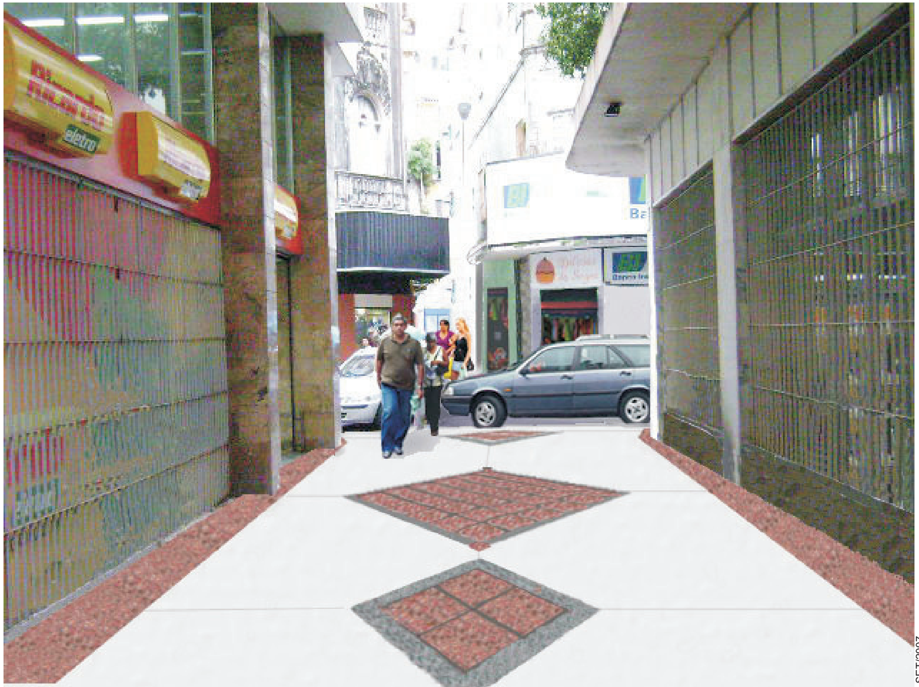
TRECHO BECO DOS ALGIBEBES