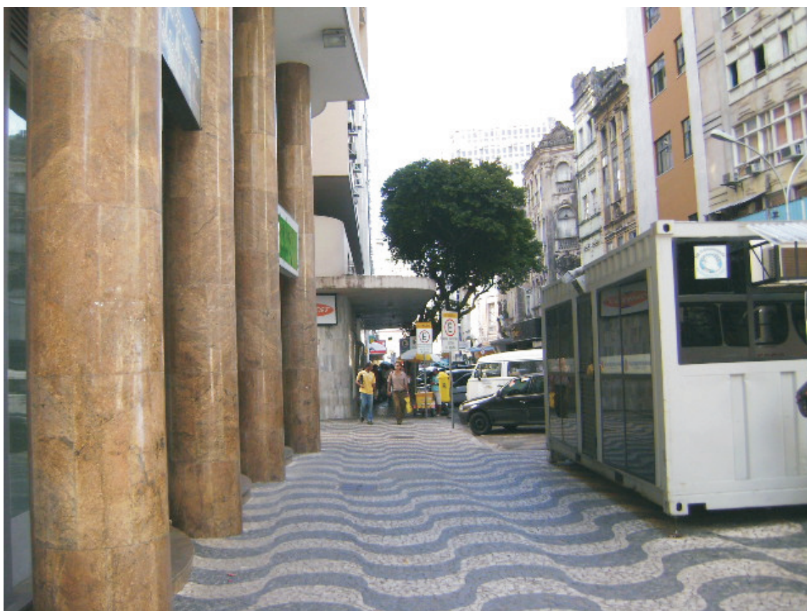
Vista de passeio situado à Rua Conselheiro Dantas (Edif. Comendador Pereira)