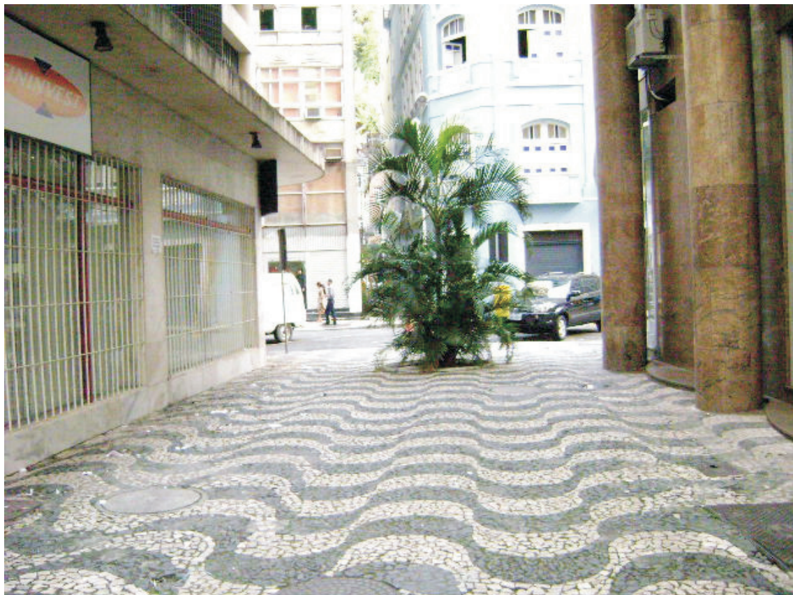
Passeio do Beco do Adão