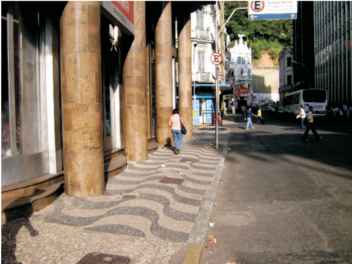
Vista de passeio da Rua Pinto Martins