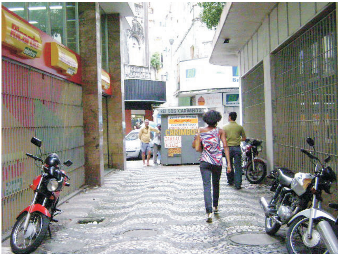
Beco dos Algibebes