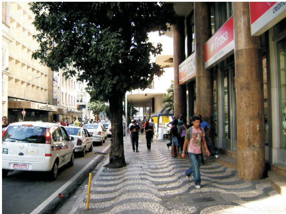
Vista de passeio à Rua Miguel Calmon