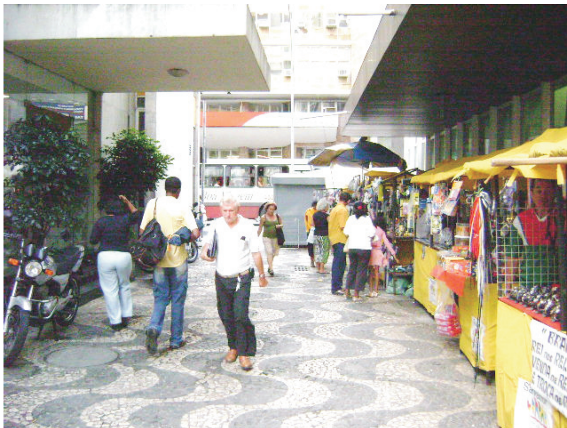
Comércio informal situado à Rua Francisco Gonçalves