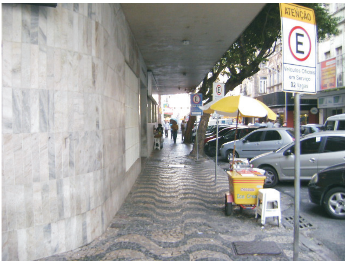
Vista de passeio situado à Rua Conselheiro Dantas (Edif. Paraguassú)