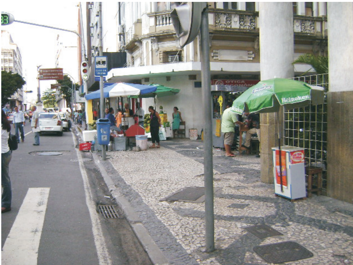
Vista de passeio da Ricardo Eletro situado à Rua Miguel Calmon