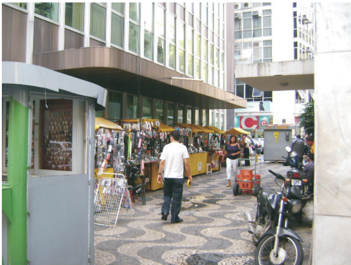
Vista de passeio da Travessa da Rua Francisco Gonçalves