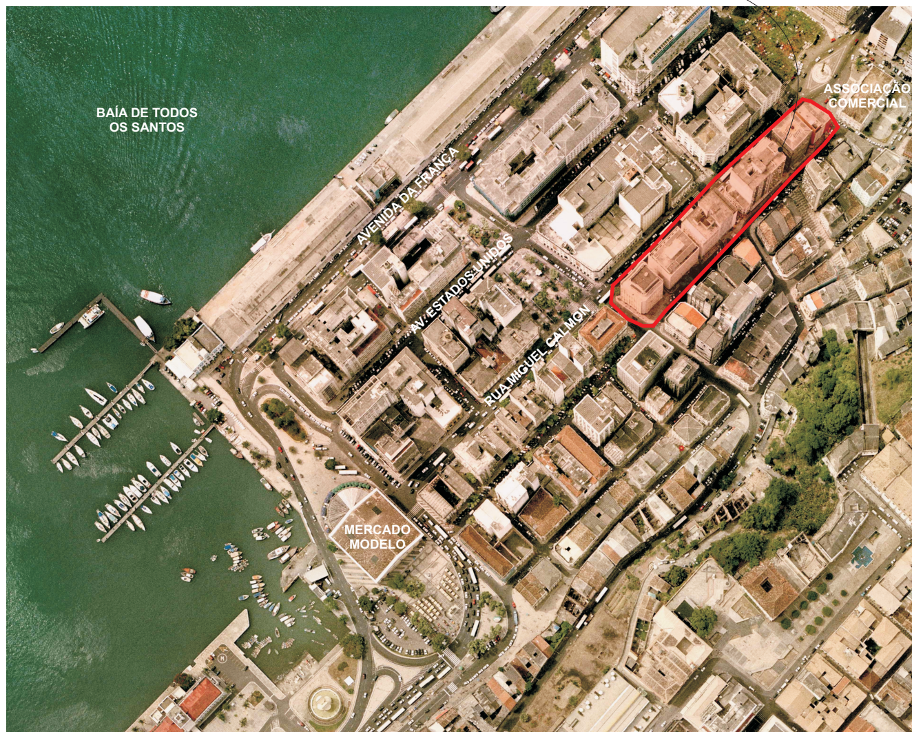
Bairro do Comércio