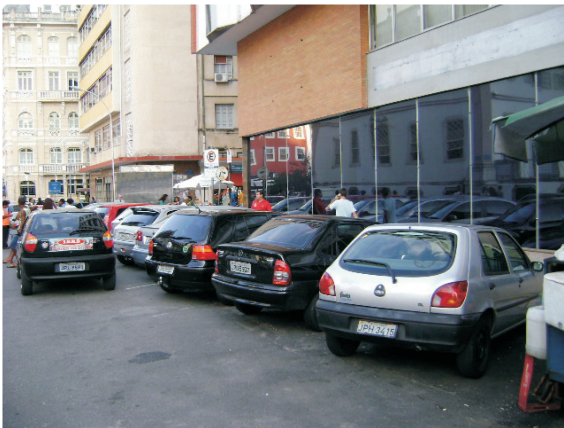
Vista de passeio situado à Rua Conselheiro Dantas (Edif. Bradesco)