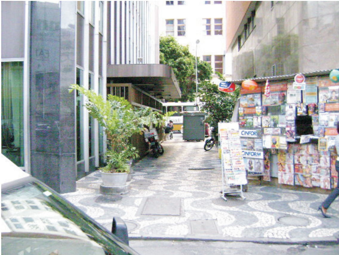
Vista de passeio da Travessa da Rua Pedro Rodrigues Bandeira