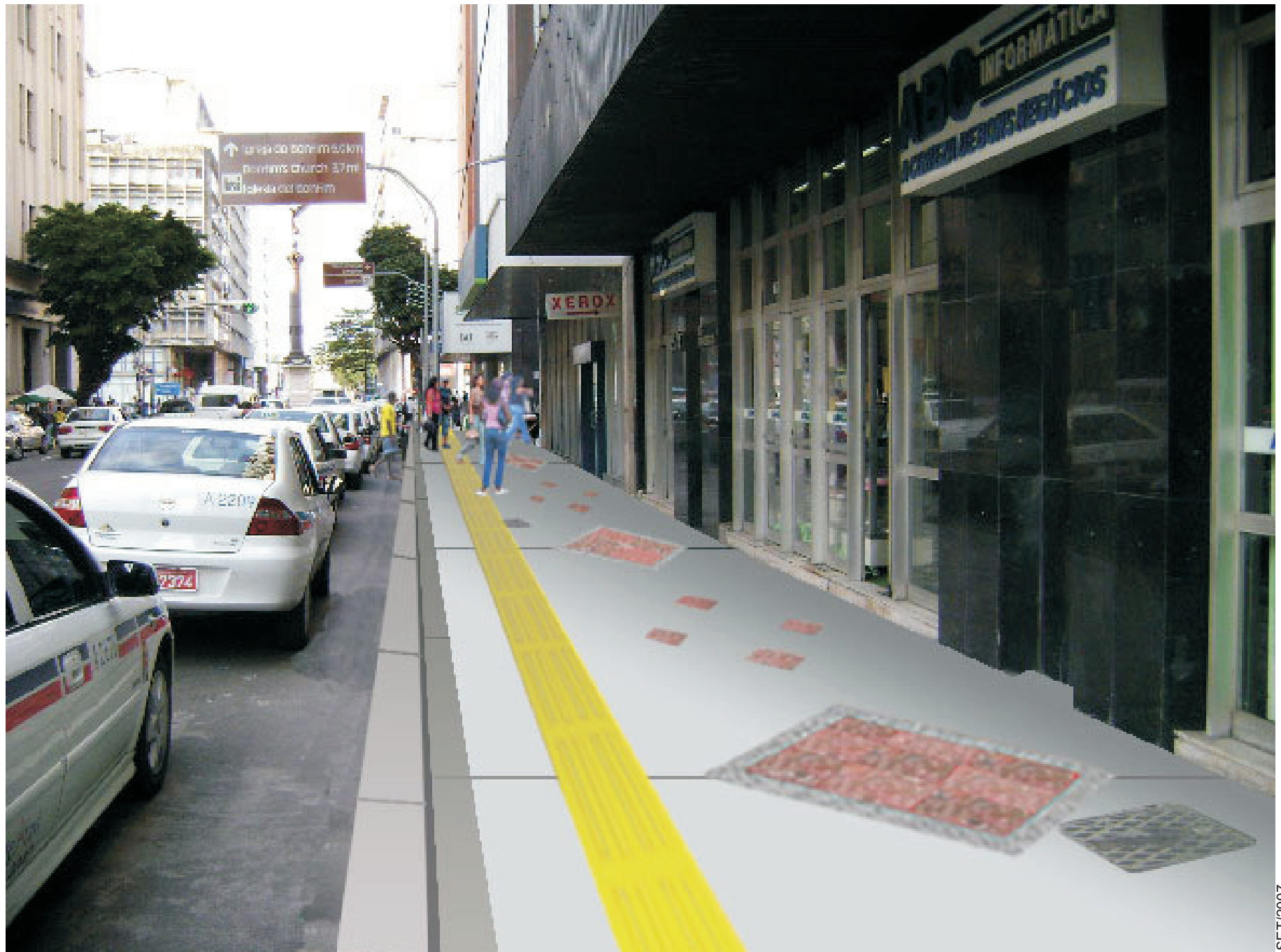
TRECHO RUA MIGUEL CALMON