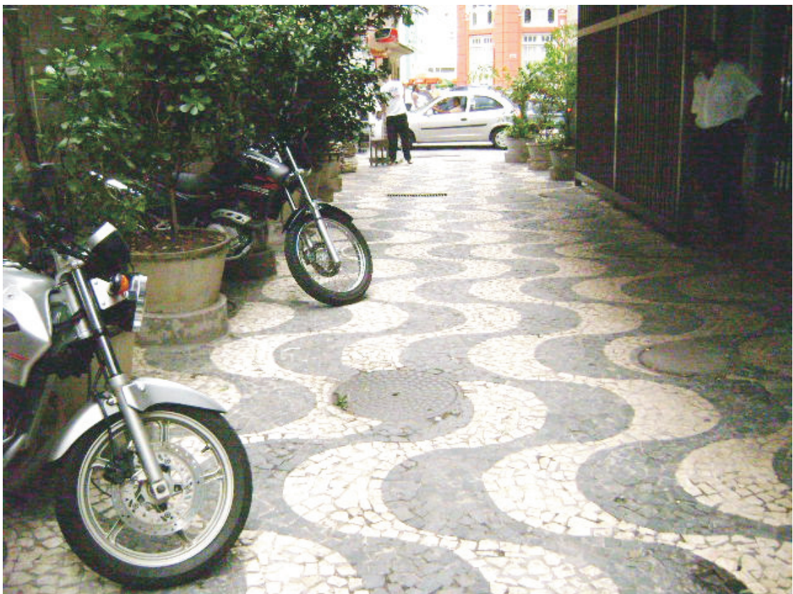
Vista de passeio da Travessa da Rua Pedro Rodrigues Bandeira