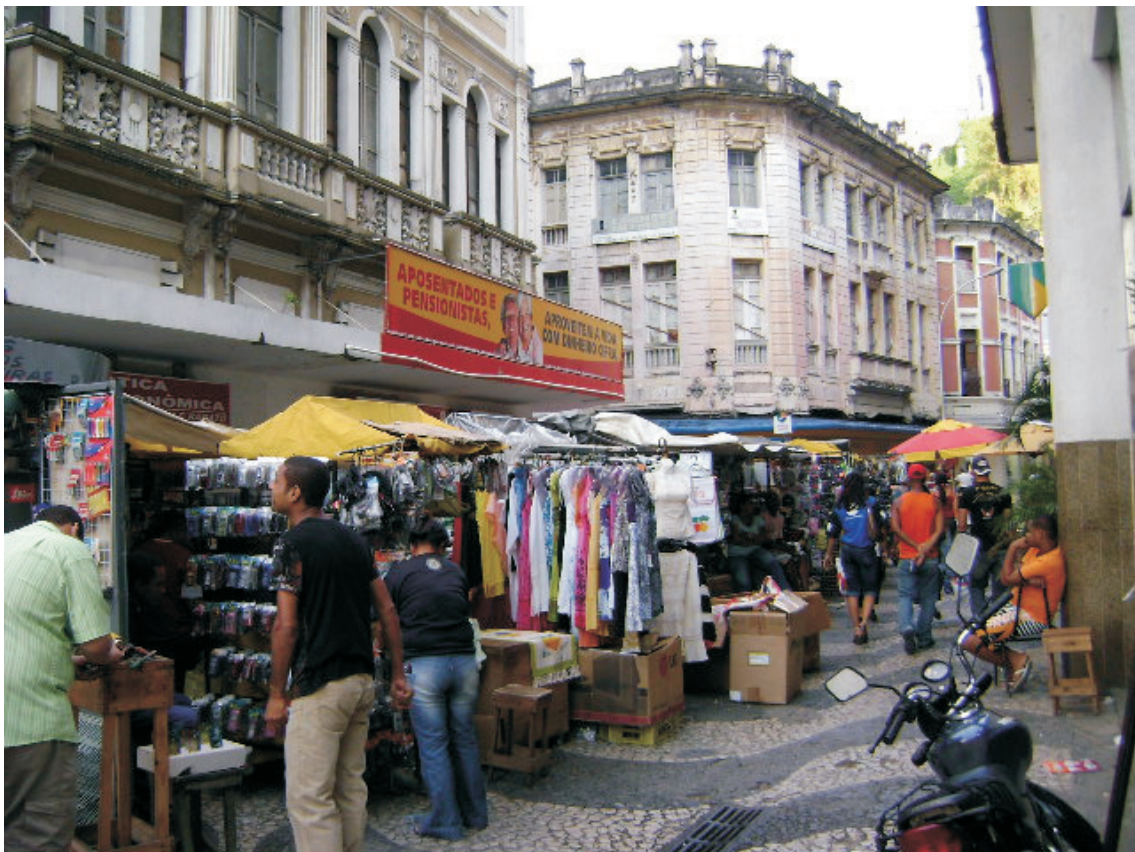
Vista de passeio situado à Rua dos Ourives