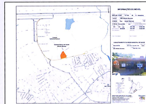
Imagem 03 - Rede Municipal de Saúde - Planta de Situação