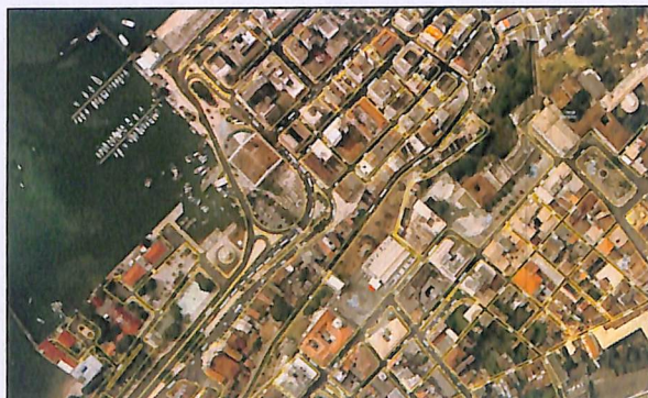
Imagem 02 - Ortofotocarta - 2006