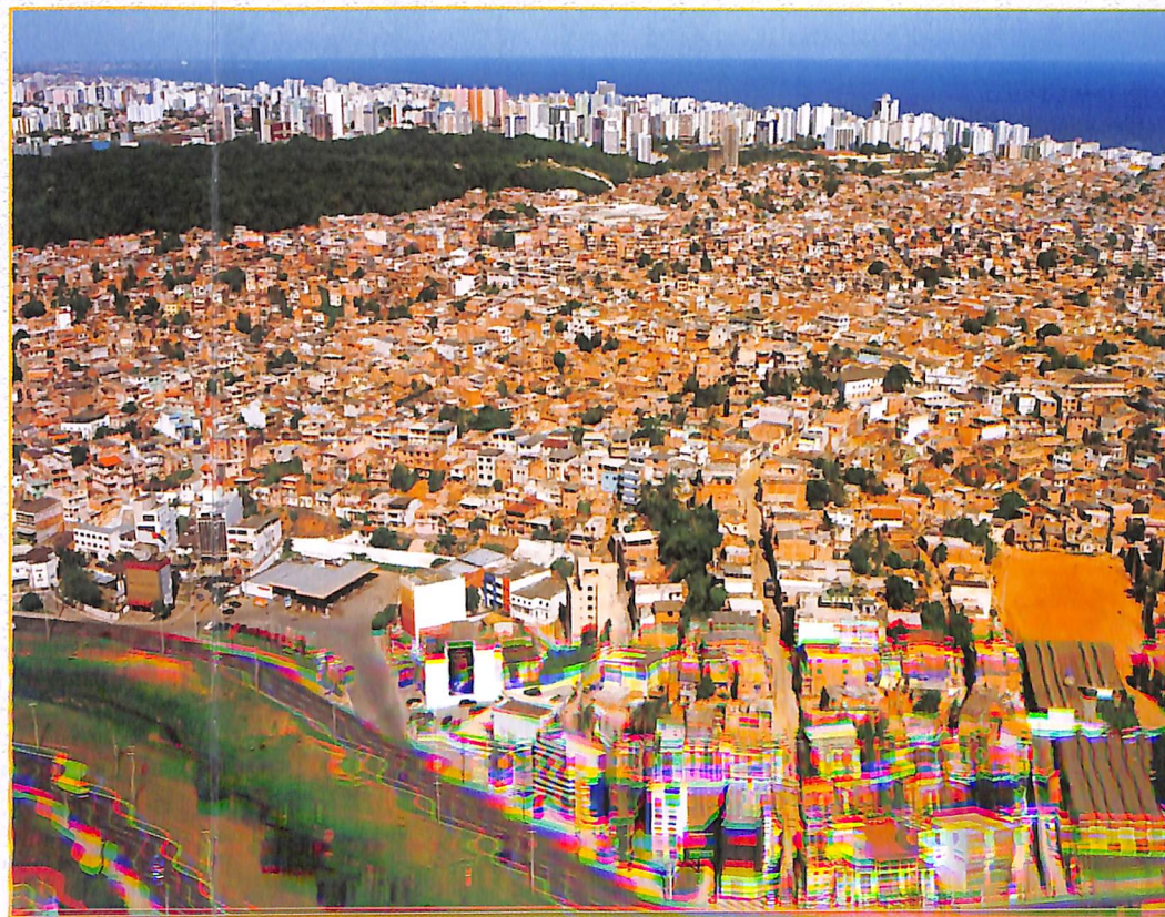
Nordeste de Amaral e Pítuba.

O Salário Mínimo de referência é o de julho de 2000: R$ 151,00