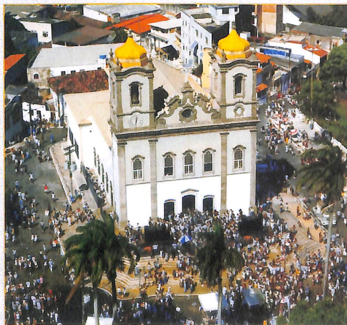
Festas populares como a Lavagem do Bonfim ajudam a compor o variado cenário cultural de Salvador.