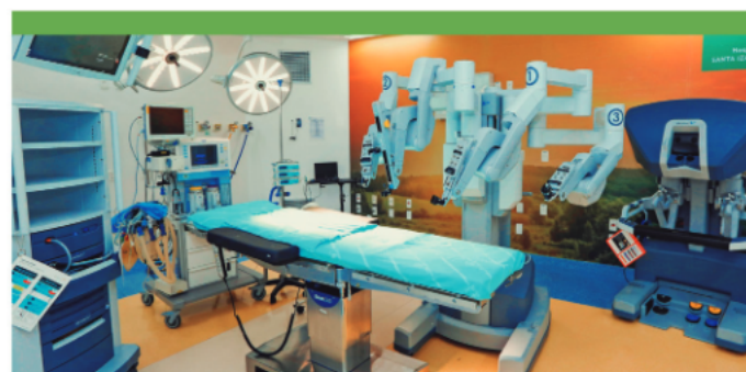
Centro Cirúrgico do Hospital Santa Izabel

A história da Santa Casa da Bahia se confunde com a da cidade de Salvador, especialmente no âmbito da Saúde. Fundado como Hospital da Caridade, o Santa Izabel se caracteriza pelo atendimento humanizado nas mais diversas especialidades, com destaque para as áreas de Cardiologia (reconhecida como centro de alta complexidade pelo Ministério da Saúde), Oncologia, Ortopedia, Otorrinolaringologia, Pediatria e Neurologia.