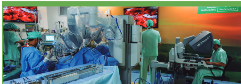
Primeira cirurgia robótica