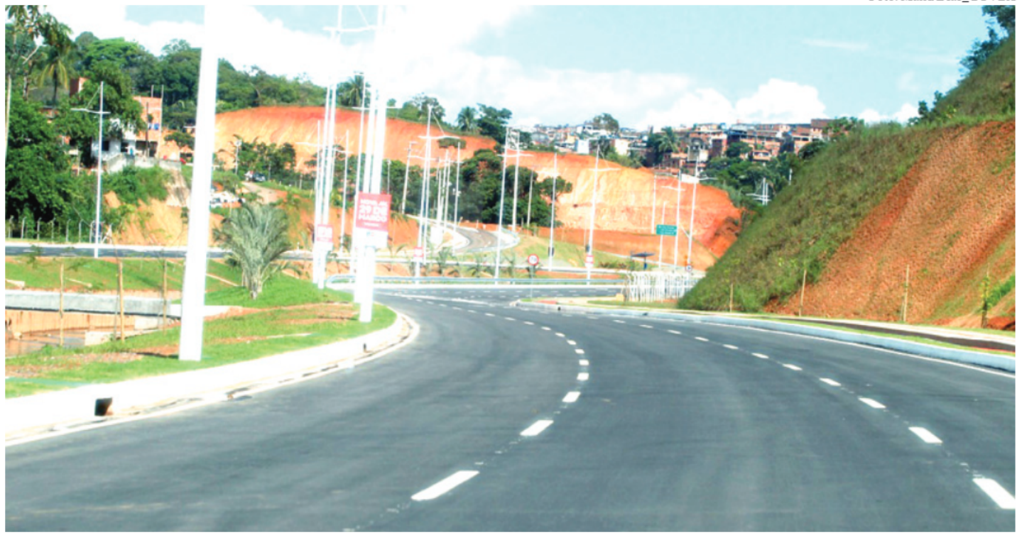
LINHA VERMELHA O trecho liga a Estrada Velha do Aeroporto à Via Regional

Os recursos para a obra da 29 de Março foram aplicados em serviços de terraplanagem, pavimentação, drenagem, paisagismo, ciclovias, passeios, além de acesso aos bairros do entorno da via e iluminação em LED. A obra de macrodrenagem com retificação do Rio Jaguaribe, que fica no canteiro central, e separa as duas pistas da avenida, também foi