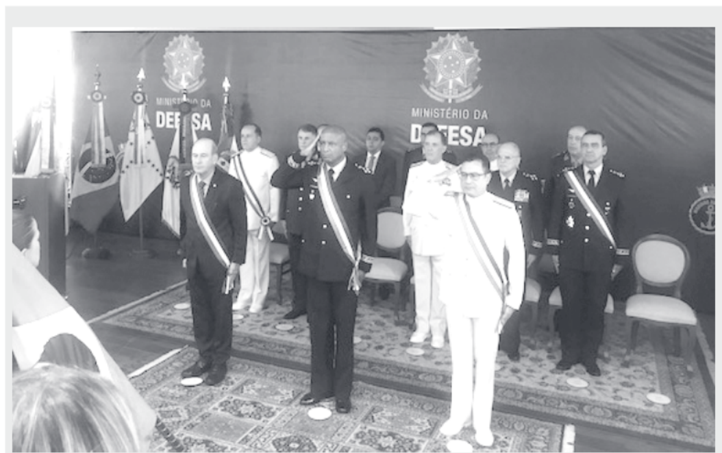
O ex-comandante do segundo Distrito Naval, Almirante de Esquadra Almir Garnier, acaba de tomar posse na secretaria geral do Ministério da Defesa do Brasil. Este é o segundo cargo na hierarquia de toda a estrutura de Defesa militar do País, comandando Exército, Marinha e Aeronáutica.