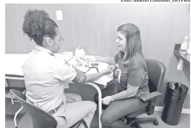
ATENÇÃO PMS podem contar com atendimento em diversas áreas