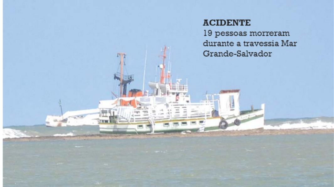
ACIDENTE 19 pessoas morreram durante a travessia Mar Grande-Salvador