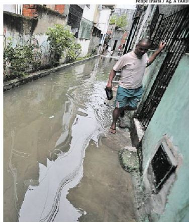
Pedestre passa por rua alagada no bairro de Uruguaia