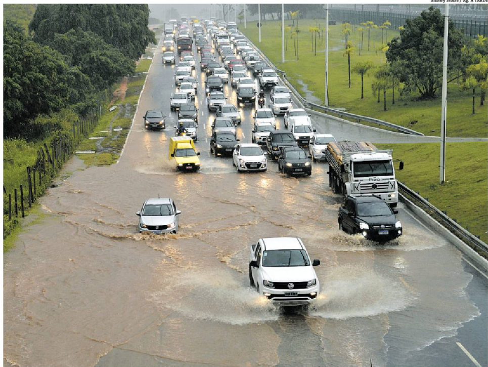
Fortes chuvas provocaram vários pontos de alagamento e causaram longos congestionamentos na avenida Paralela ao longo do dia de ontem