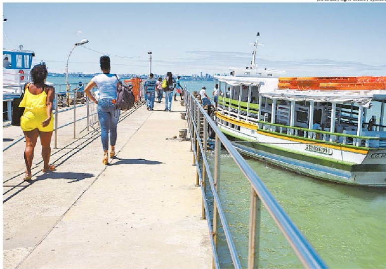
Passageiros embarcando na lancha Cavalão Marinho III durante a retomada da travessia na terça-feira passada

*SOB A SUPERVISÃO DA EDITORA MEIRE OLIVEIRA