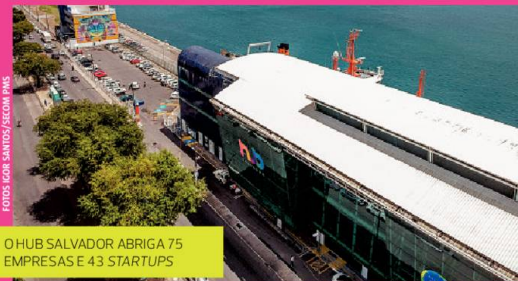
O HUB SALVADOR ABRIGA 75 EMPRESAS E 43 STARTUPS

O Comércio tem sido alvo de uma série de melhorias nos últimos anos, graças a iniciativas como o programa municipal Salvador 360, que prevê investimentos de R$ 300 milhões em todo o Centro Histórico de Salvador. Muitas dessas melhorias já foram conduzidas, a exemplo da entrega do Hub Salvador.