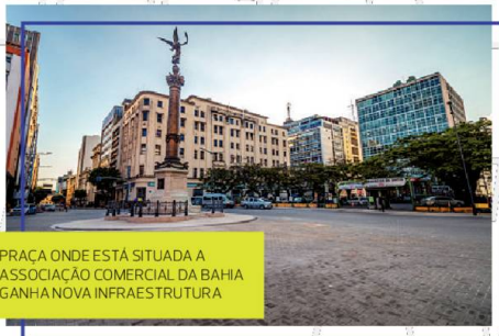
PRAÇA ONDE ESTÁ SITUADA A ASSOCIAÇÃO COMERCIAL DA BAHIA GANHA NOVA INFRAESTRUTURA