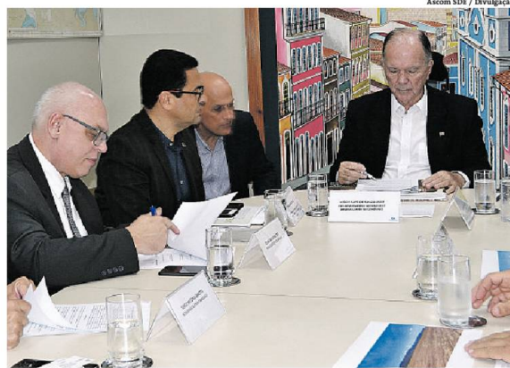
Anúncio foi feito durante a assinatura de protocolos de intenções na SDE