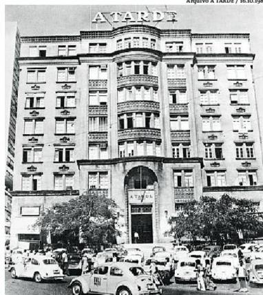
A icônica sede de A TARDE na praça Castro Alves foi restaurada com esmero por 10 anos pelo Grupo Fasano