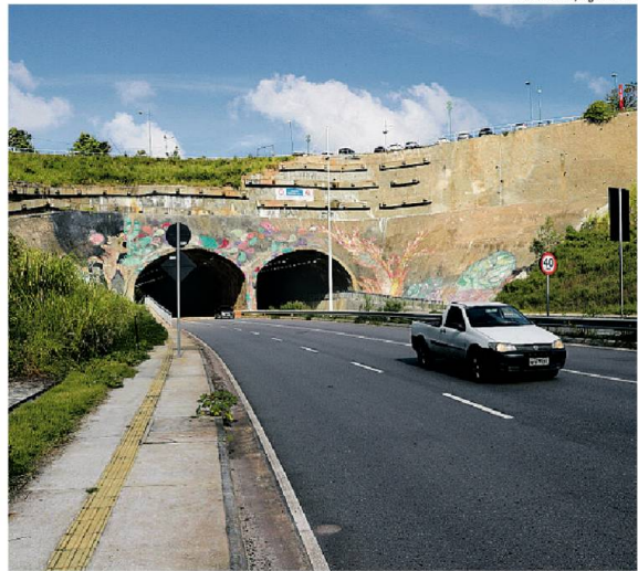
Expectativa é trazer fluidez no entorno e beneficiar milhares de pessoas por dia

As intervenções serão realizadas entre os bairros de Jardim Cajazeiras e Pau da Lima e as mudanças decorrentes das obras objetivam