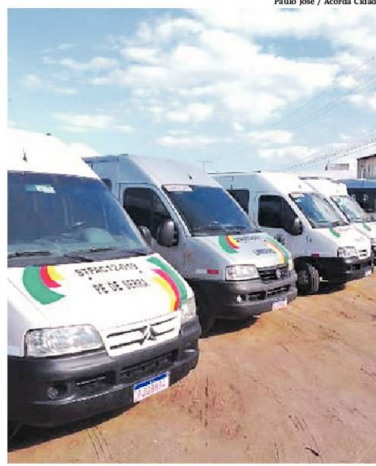
Vans são motivo do protesto dos rodoviários em Feira de Santana