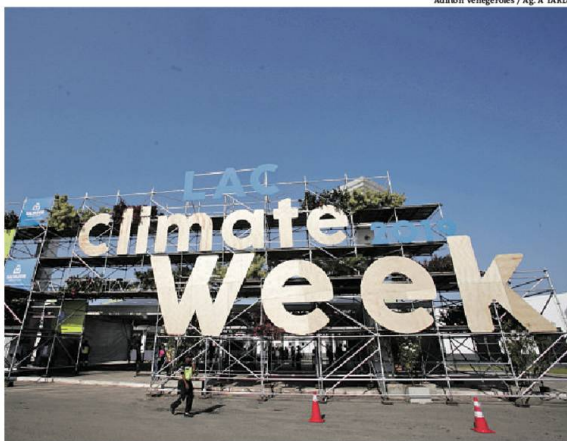
O evento acontece no Salvador Hall, na avenida Paralela, até a próxima sexta-feira

"Ela chamou a minha atenção, acho que a gente