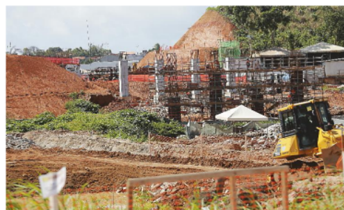
Canteiro de obras já é visível próximo a Lauro de Freitas, na RM5