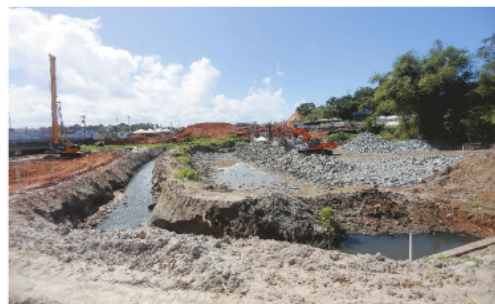
Linha de ônibus gratuita vai levar da estação do Aeroporto até Lauro