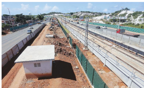
Previsão é que o trecho de metrô seja entregue até dezembro

"Ter um shopping aliado ao Salvador Norte Shopping e ao Shopping Busca Vida (também na Estrada do Coco, mas já em Camaçari), fará com que as pessoas na cidade possam ter equipamentos super importantes para lazer e negócios, com o desenvolvimento do mercado imobiliário".