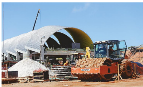
Obras para que o metrô chegue ao aeroporto já estão em andamento