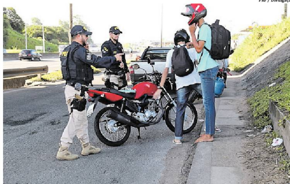
Nos postos fixos e pontos estratégicos foram abordados 9.837 veículos e 9.443 pessoas

A operação contabilizou ainda 25 veículos recuperados e 52 pessoas detidas por variados crimes. No período,