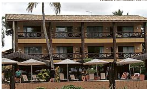
Parte da área da piscina fica em terreno de propriedade da Marinha

“É importante explicar que se trata de uma sobreposição da área verde e da via pública, ambas incluídas no terreno de Marinha, na área de preamar, sobre a qual não é possível haver edificação do tipo que existe, a exemplo de uma parte de azulejos do deck da piscina e do bar”.