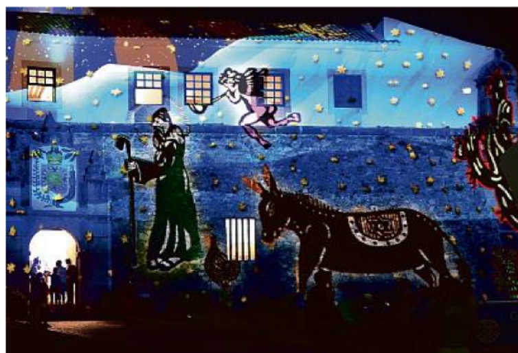
O filme natalino mostra também referências da Bahia, como o acarajé e o Carnaval, e do Nordeste

“ Não vou me cansar de ver! Achei muito impressionante, porque dá pra ver tudo com clareza