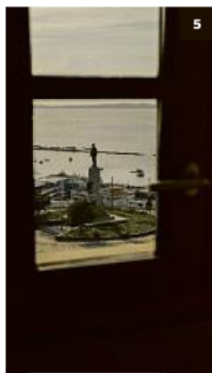
1 | Fachada Frente do prédio que foi sede do A Tarde foi mantida: Imóvel foi tombado em 2008 2 | Apartamento são 70, de 30m 2 a 75m 2 3 | Piscina Fica no Rooftop e é revestida em granito Azul Bahia 4 | Teto Decoração tem leveza 5 | Vizinho Hotel tem vista para a estátua do poeta Castro Alves 6 | Decoração Móveis têm linhas retas

co, o primeiro neste estilo, que preserva as características clássicas, mas com um conceito contemporâneo", explica Constantino Bittencourt, CEO do Fasano. Este é o sétimo empreendimento hoteleiro do grupo - primeiro do Nordeste - e quarto de perfil urbano.