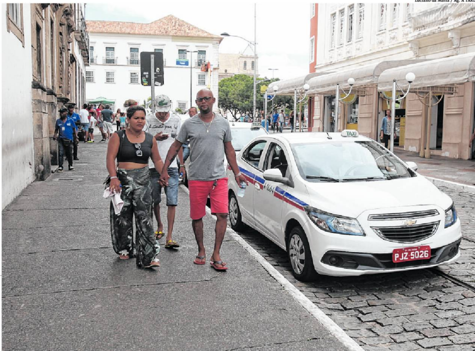
De acordo com a Semob, dos mais de 7,5 mil veículos utilizados como táxis na capital baiana, dois mil já estão cadastrados na plataforma

* SOB SUPERVISÃO DA JORNALISTA RITA CONRADO