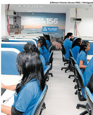
Profissionais na central de atendimento da Defesa Civil

"Em média, atendemos mais de duas mil pessoas por dia. Na maioria, trotes de crianças que são mais breves falando besteira e, também, pessoas mais velhas. Isso, infelizmente, acontece com