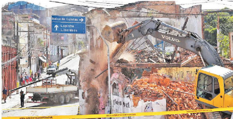
O casarão localizado entre a Ladeira da Soledade e a rua São José de Cima já desaparece do cenário do bairro

A resposta do Ipac, contou Ferraz, só foi recebida em 26 de julho deste ano. O diretor-geral do órgão mostrou o documento, onde o instituto informou que é "de parecer favorável à demolição da empreza lateral do imóvel e de demais elementos que ve-