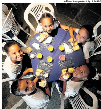
Alunos do projeto Hora da Criança em ação da Sobape