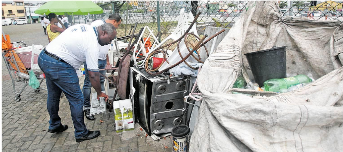
Na praça Irmã Dulce, no largo de Roma, agentes do CCZ dos distritos de Itapagipe e subúrbio ferroviário alertaram a população sobre a importância da conscientização