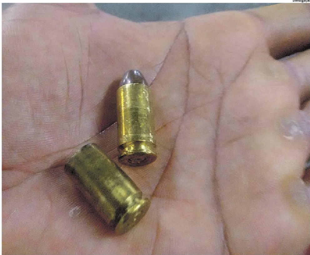
Cápsulas das munições foram encontradas no shopping após o tiroteio ocorrido entre seguranças e criminosos

Informações preliminares dão conta de que quatro homens armados renderam os seguranças e, na fuga, fizeram disparos de arma de fogo, antes de deixarem o local