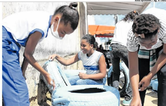
Alunos e familiares pintaram pneus, plantaram mudas e fizeram a coleta do lixo