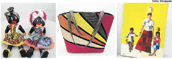
O público vai encontrar desde oficinas a produtos diversos, como bonecas, bolsas e quadros