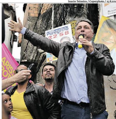
Por 3 votos a 0, Garotinho teve a pena aumentada

ex-governador. Anthony Garotinho também deverá ser preso assim que o TRF-2 autorizar o mandado. O documento, contudo, só deverá ser expedido após a defesa do ex-governador esgotar os recursos na Corte através de embargos de declaração. A defesa do ex-governador informou que vai recorrer. Vingança Em entrevista concedida nesta terça à noite, após a decisão do TRF-2, Anthony Garotinho se disse vítima de perseguição de pessoas alvo de denúncias suas, e falou em vingança.