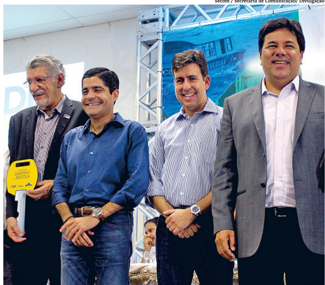
Encontro do MEC ocorreu no campus da Ufba do município de Vitória da Conquista