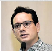
Elis Pereira / CBC

"Temos um ecossistema de inovação em maturidade em Salvador"