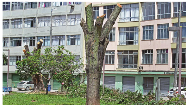
Entre as árvores podadas há irokos, que são consideradas sagradas pelo candomblé