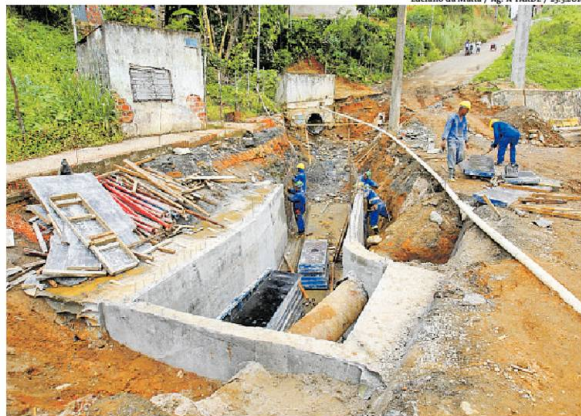
Intervenção é feita na estrada que dá acesso a áreas do subúrbio ferroviário

A pé pelo trecho interditado, em visita a um amigo, Lucas Silva, 25, contou que