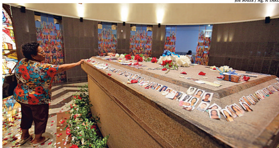
O santuário da Bem-Aventurada Dulce dos Pobres abriga o túmulo da religiosa

A implantação do Corredor da Fé foi bem avaliada pelo