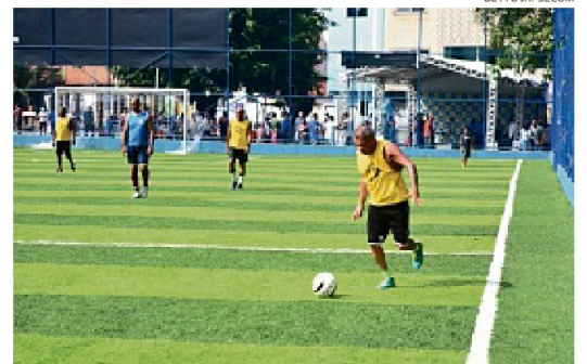
Prefeitura projeta encerrar o ano chegando a 100 campos sintéticos

ças e adolescentes. A obra foi inaugurada pelo prefeito Bruno Reis e pelo secretário de Promoção Social, Combate à Pobreza, Esportes e Lazer (Sempre), Júnior Magalhães. "São 43 campos com grama sintética entregues nos últimos três anos, e a requalificação feita aqui no Areal era um desejo antigo dos moradores", afirmou o prefeito Bruno Reis.