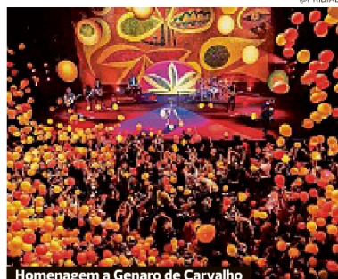
Homenagem a Genaro de Carvalho