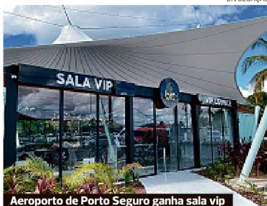
Aeroporto de Porto Seguro ganha sala vip