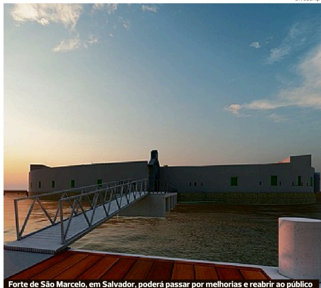
Forte de São Marcelo, em Salvador, poderá passar por melhorias e reabrir ao público