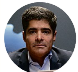
ARISSON MARINHO/ARQUIVO CORREIO