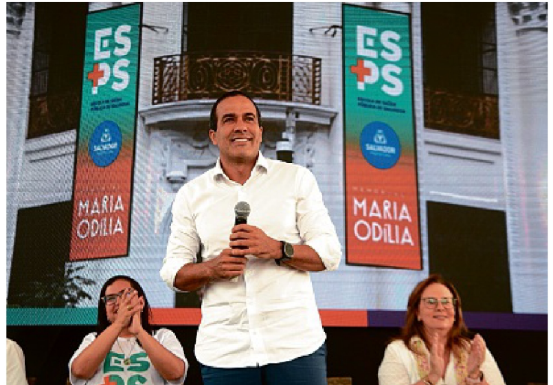
Unidade fica no Comércio e atenderá cerca de 12 mil profissionais de saúde da prefeitura de Salvador

O prédio da escola tem 1 mil metros quadrados de área, quatro pavimentos,