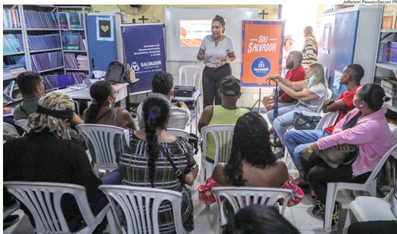
Ambulantes do camelódromo de São Cristóvão participaram recentemente da capacitação

“O Capacita Salvador foi desenvolvido para fornecer mão de obra adequada para o trade turístico e, dessa forma, aumentar a renda da população soteropolitana. É muito importante fazermos a política pública chegar à ponta, então, tirar essas ideias do papel e levar para os bairros foi essencial”, explicou o diretor da Prodetur, Iuri Mattos.