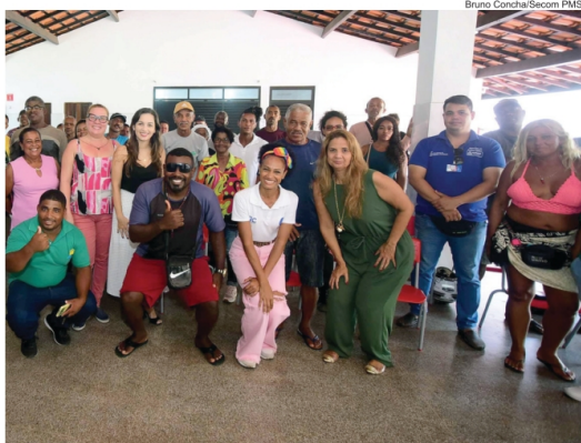
Ação beneficiou 113 donos de barracas de praia entre Patamares e Itapuá

Diretora do Trabalho e Empreendedorismo da Semdec