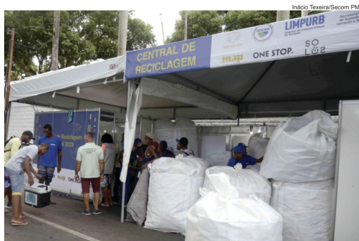
Centrais de Reciclagem são implantadas pela Prefeitura em áreas próximas aos circuitos

São cinco Centros, instalados em escolas da rede municipal localizadas em pontos estratégicos próximos aos circuitos, com a oferta de cerca de 500 vagas. Os espaços funcionam 24h e contam com estrutura de dormitório, refeitório, brinquedoteca, sala de leitura e de TV, além de cinco refeições diárias. As crianças e adolescentes re-