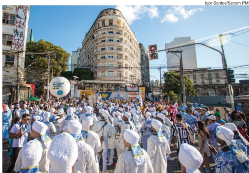
O Desfile Salvador Capital Afro contou com apresentações de blocos afro e afoxés e levou milhares ao Centro Histórico

No último sábado, o Desfile Salvador Capital Afro