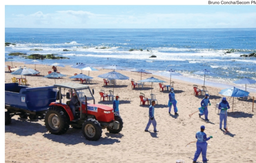
A limpeza de praias também é reforçada com o aumento do fluxo no verão de Salvador

ça Castro Alves, no Centro Histórico, com encontro de blocos afro e afoxés. Os grupos Ilê Aiyê, Olodum, Filhos de Gandhi, Didá, A Mulherada, Cortejo Afro, Ara Ketu, Bloco da Capoeira com Tonho Matéria, Filhas de Gandhi, Malê Debalê e Muzenza celebrando a ancestralidade negra da cidade.