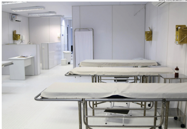
Parte interna dos módulos de saúde implantados pela Prefeitura no Carnaval

Segundo a SMS, durante as festas populares, há uma atuação direta dos serviços do SAMU, através de ambulâncias e motolâncias. Já no Festival da Virada, é implantada uma base fixa de atendimento. No carnaval, são montadas 10 estruturas, cada uma com 20 leitos e cerca de 18 profissionais, incluindo médicos e enfermeiros. Na folia de 2023, os módulos assistenciais registraram 3.380 atendimentos, incluindo cirurgias bu-