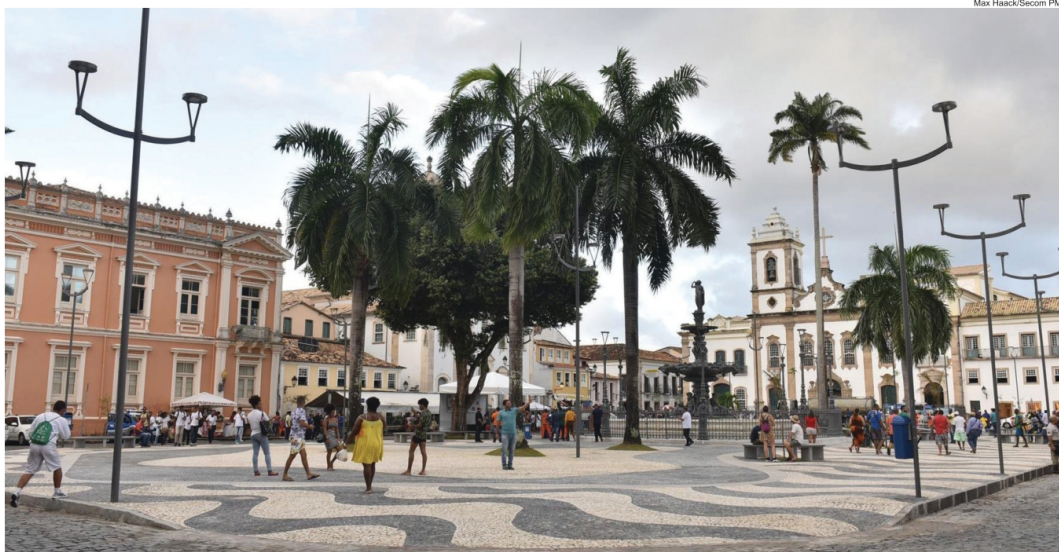
O Terreiro de Jesus, que foi requalificado pela Prefeitura, conta com segurança e limpeza diária

Ordem Pública (Semop) realiza até hoje (30), na Prefeitura-Bairro, o cadastramento dos cerca de 300 ambulantes que atuam no Centro Histórico, incluindo baianas de acarajé, pipoqueiros, vendedores de bebidas, lanches e souvenir. O serviço é para quem já tem a licença e atua na região. Novos pedidos são feitos por meio do site da Semop, mediante análise do órgão.