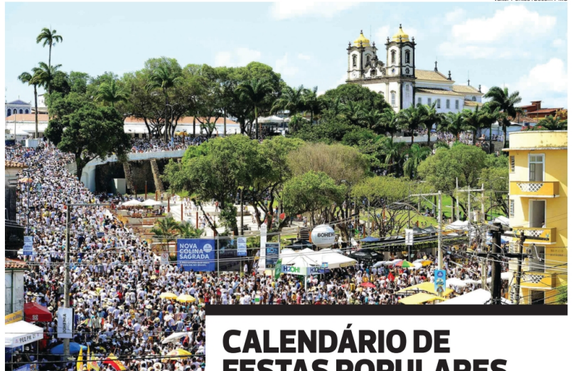
Valter Pontes / Secom PMS

O calendário de festas populares começa no próximo dia 4 de dezembro, com a Festa de Santa Bárbara. Já no dia 8, Salvador celebra Nossa Senhora da Conceição da Praia. Em janeiro, ocorre a tradicional Lavagem do Bonfim, no dia 11. A Festa de Iemanjá, em 2 de fevereiro, será numa sexta-feira, e a Lavagem de Itapuã ocorre no dia 8. Este ano, logo após a Festa de Iemanjá vem as festas de pré-Carnaval que já viraram tradição: o Fuzuê, no sábado, dia 3, e o Furdunção, no domingo, dia 4. Na terça-feira, dia 6, já tem o Pipoco abrindo a semana do Carnaval, que segue na quarta-feira com o circuito de fanfarras Sérgio Bezerra. A partir da quinta-feira, dia 8, começa a programação oficial do Carnaval, que vai até a Quarta-Feira de Cinzas, no dia 14, com o tradicional Arrastão.