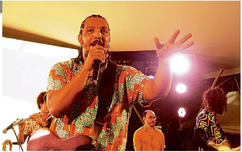
Banda IFÁ anima a plateia com músicas que mesclam ritmos como afrobeat, funk e reggae