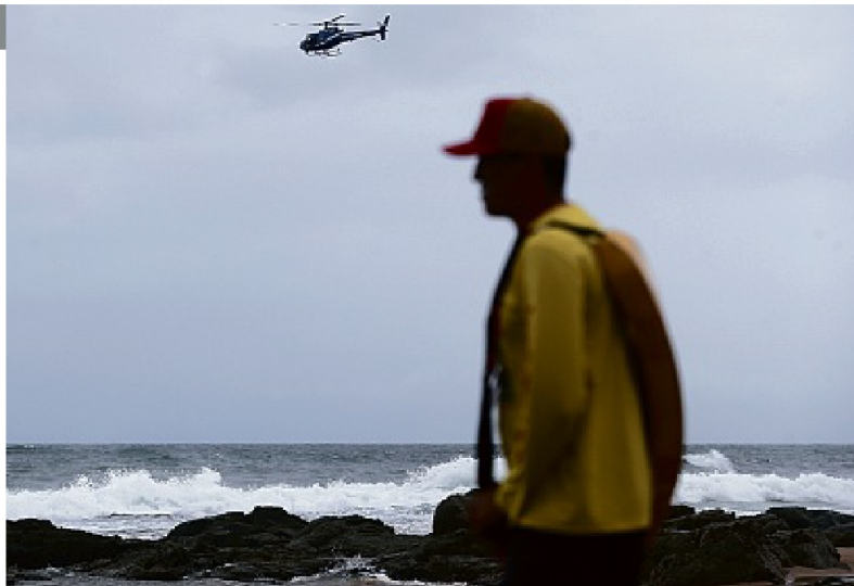
As buscas por rapaz que desapareceu no domingo continuam com mergulhadores e equipes por ar e terra

Em 2022, até outubro, foram 904 afogamentos. Considerando apenas este mês, os casos de 2023 (104) em