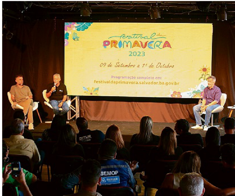
Evento realizado ontem apresentou a programação do evento, entre as atrações confirmadas estão Pitty, Mudei de Nome e Guig Ghetto