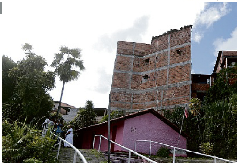
Prédio construído sem autorização no Engenho Velho da Federação invade o terreiro da Casa Branca

A obra irregular foi interdita em março pela Sedur. Em nota, a pasta informou que a interdição ocorreu após identificar material de construção no local. O órgão ressaltou ainda que a construção já havia sido embarcada em setembro de 2022