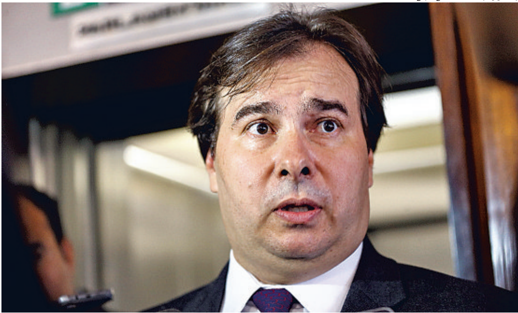
Maia evita usar o termo adiamento e fala em “aprofundamento na articulação”

Em função da forte resistência no Congresso ao texto da proposta de emenda à Constituição (PEC) da reforma da Previdência, o presidente da Câmara, Rodrigo Maia (DEM-RJ), já admite adiar a votação inicialmente prevista para o dia 8 de maio. “Se possível vamos votar a matéria no dia 8 de maio, se não for possível, a partir do dia 15”, disse ontem, em Foz do Iguaçu, onde participa do 16º Fórum Empresarial organizado pelo Grupo de Líderes Empresariais (Lide). Apesar de assumir que, hoje, o governo não tem votos suficientes para garantir a aprovação, Maia disse que não se trata propriamente de um adiamento. Segundo ele, trata-se de um “aprofundamento na articulação” junto às bancadas para uma melhor compreensão do texto entregue nesta semana pelo relator, deputado Arthur Maia (PPS-BA). “Não haverá adiamento, haverá articulação. E a votação quando estivermos a