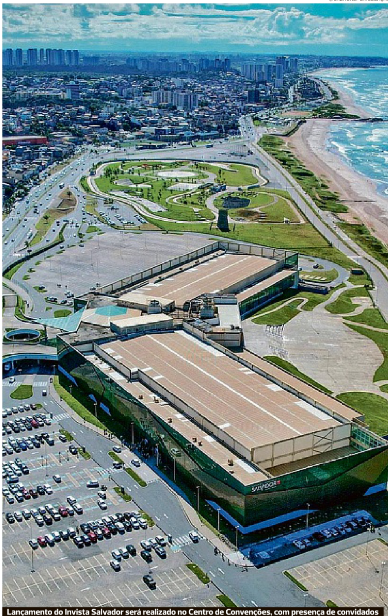
Lançamento do Invista Salvador será realizado no Centro de Convenções, com presença de convidados