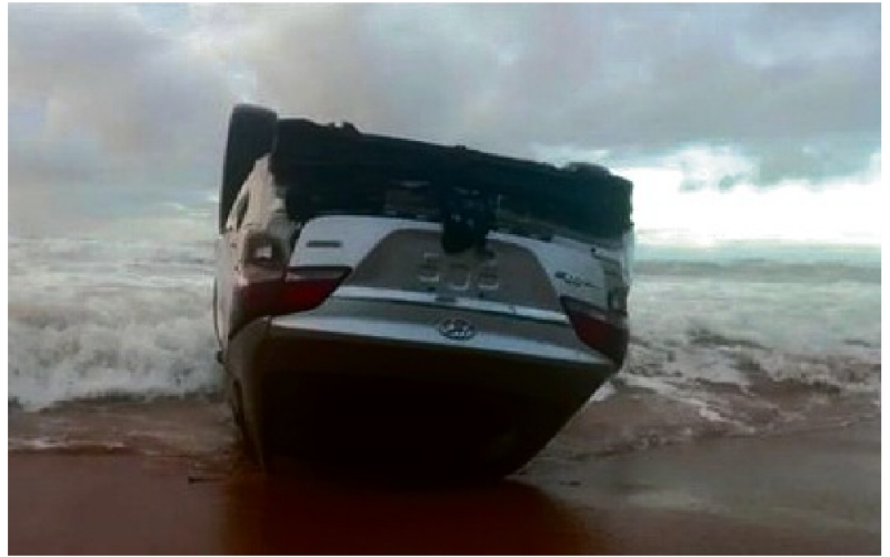
O veículo ficou com as rodas para cima em Ipitanga, na região metropolitana

Moradores da região informaram que não é a primeira vez que isso acontece no local. A rua é sem saída, e alguns motoristas já se confundiram com a continuidade da via, que dá na escadaria. Não há câmeras de segurança no trecho onde o veí-