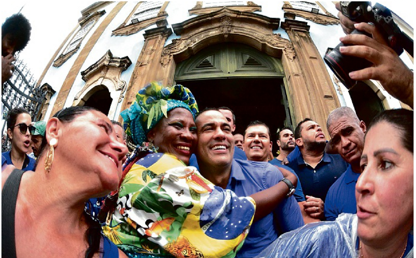
Uma das muitas homenagens durante o cortejo foi uma breve parada em frente à igreja de Nossa Senhora do Rosário dos Pretos, no Pelourinho